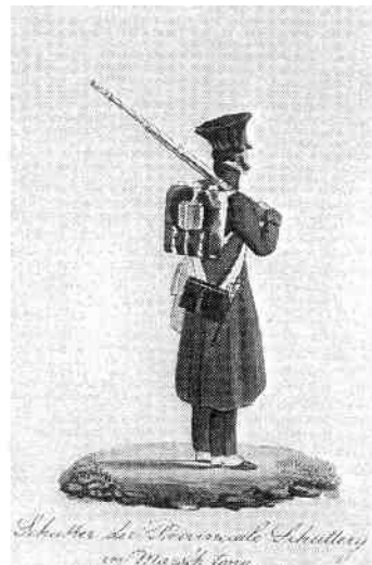
Schutter in marstenuue

Schutter der 5 e Compagnie Schutters en Marstenuue