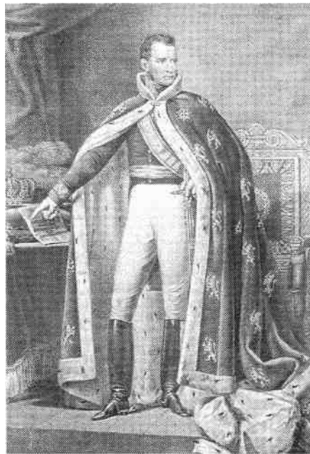
Statieportret van Koning Willem I voor zijn gebeeldhouwde troon.