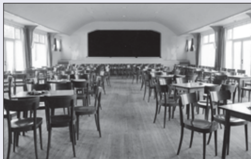
De 'toneelzaal' van Mulder was vanaf de ingebruikname een groot succes.

Naast deze speciale avonden was er iedere zaterdagavond dansen. Om 20.00 uur was de zaal open en om ± 20.30 uur begon de muziek te spelen. Bandjes die vaak bij Mulder kwamen waren: