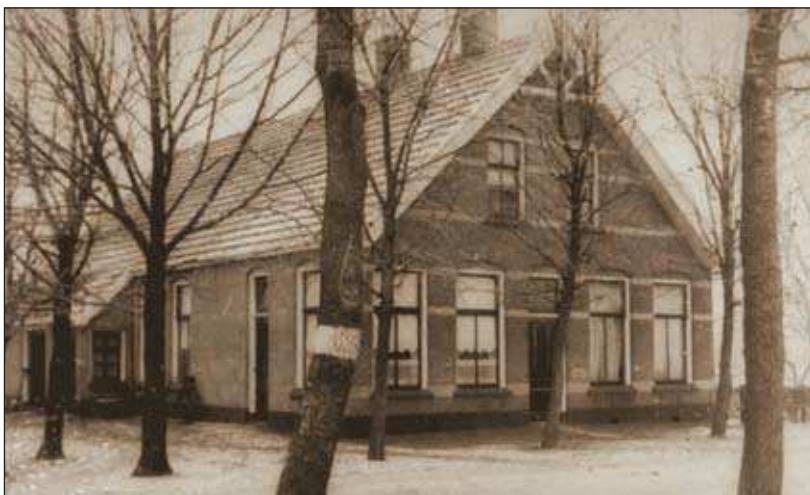
Prentbriefkaart uit 1915 van het enkele jaren eerder na brand herbouwde café in Baalder.